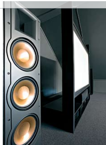
Lerretskonstruksjonen sett fra siden.