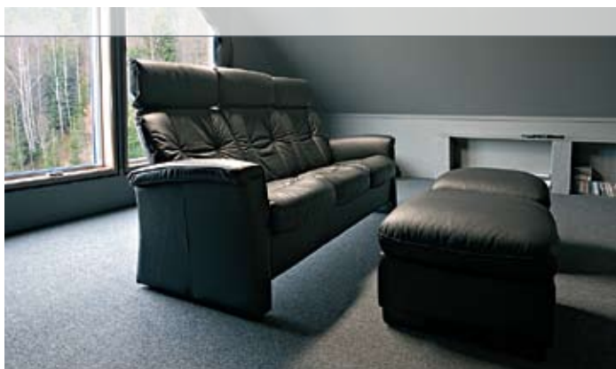
Denne sofaen er på vei til å bli en slager i hjemmekinomiljøet.

– Ja, det er for så vidt det, men det er kun evakuering av luft. En luftpumpe sørger for et lite undertrykk, noe som gjør at det blir en fin luftsirkulasjon her inne.